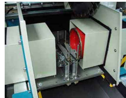
Exaktes, planparalleles Schleifen einer Rundprobe durch gleichzeitige Bearbeitung von zwei Seiten mit je einem Schleifkopf. Automatischer Vorschub der Schleifeinheiten mit Elektrozyklern