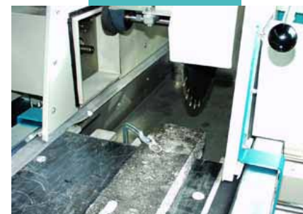
Sägen einer Asphaltplatte mit dem Diamantsägeblatt, Ø 450 mm