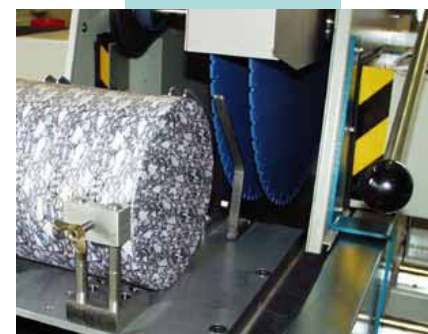
Sägen eines Bohrkerns 300 mm mit dem Doppelsägeblatt, Ø 650 mm